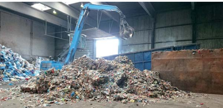
Input Material, vor der Zerkleinerung mit dem Granulator