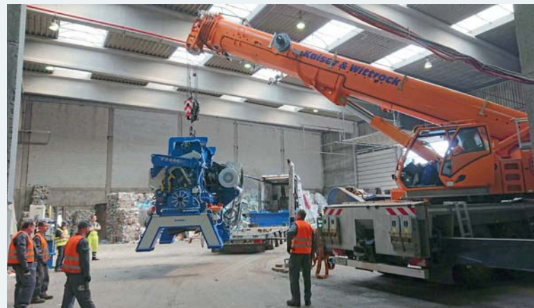
Entladen des neuen Granulators Typ AG2008