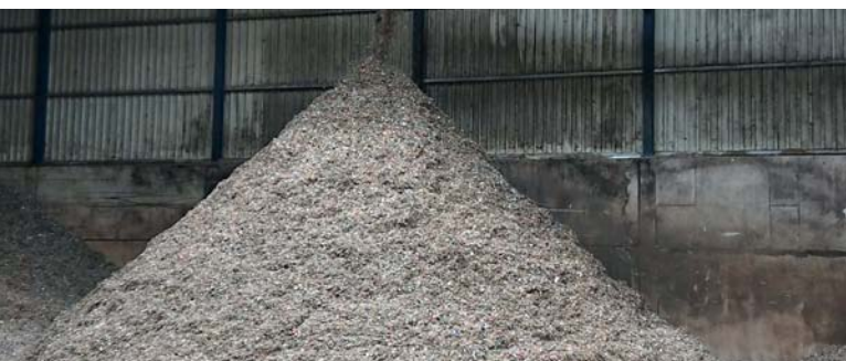
Output material nach der Zerkleinerung mit dem Granulator, fertiger Ersatzbrennstoff

Unter dem Motto „ Tönsmeier – Wir holen das Beste raus “ ist das Familienunternehmen Tönsmeier mit einer breiten Leistungspalette europaweit als Umweltdienstleister und Energielieferant tätig. Über 3.000 Mitarbeiter betreuen mit rund 1.100 Fahrzeugen kommunale Auftraggeber, duale Systemträger und Kunden aus Industrie und Gewerbe. Tönsmeier leistet mit über 30 Aufbereitungs-, Sortier- und Recyclinganlagen einen wichtigen Beitrag zur Schonung natürlicher Ressourcen.